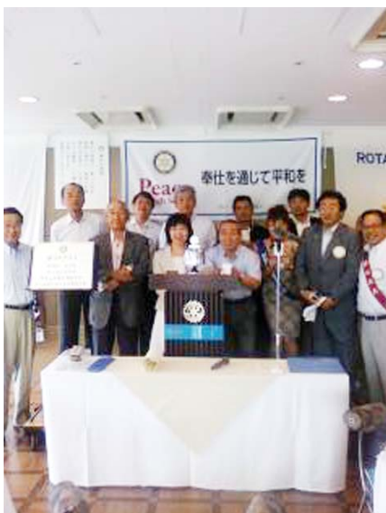
前年度の皆出席者の会員皆様